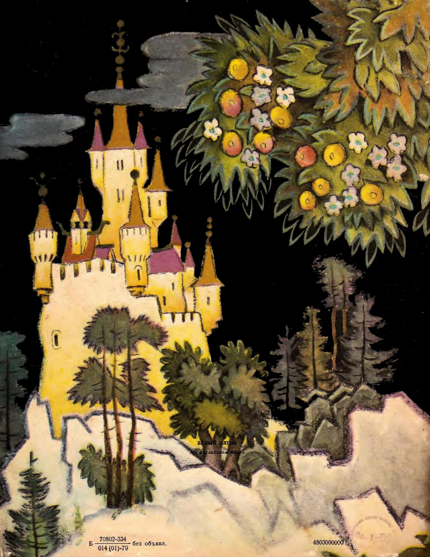
БЕЛЫЙ ОЛЕНЬ на английском языке